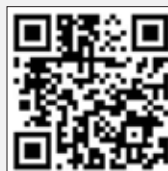
遲緩兒基金會 粉絲專頁