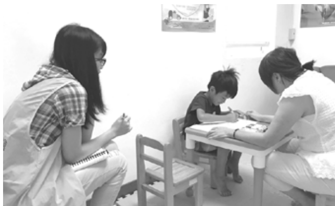
基金會定點療育課程

95年12月在善心人士的資助下，基金會開始在偏鄉推展院外評估服務計畫的籌備。96年開始在偏鄉推展由兒童健康發展為起點，推展社區發展篩檢，發現疑似發展遲緩兒，推動院外評估、發展遲緩兒童的定點、在宅服務及社區的親子成長團體。也許我們做的不多，但這一小點的服務引起政府的重視，內政部兒童局於98年開始辦理「發展遲緩兒童到宅服務及社區療育據點試辦計畫」、國健署也要求各縣市的發展遲緩兒童聯合評估醫院，需要部份負起療育資源不足地區的院外評估服務。這幾年來，偏鄉的療育服務遍地開花，頓時也成了很多機構募款的計畫。我個人不太喜歡用弱勢來形容偏鄉的家庭和孩子，因為這都是個人主觀的感受，也許生長在偏鄉的發展遲緩兒童家庭，家長缺少穩定的工作與收入、教育程度也許不夠好、對孩子的親子教養能力在專業眼中也許不足，但始終相信有人持續投入就會帶來改變。