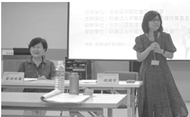
衛生福利部社會及家庭署祝健芳副署長致詞

領域的實務經驗外，也可以了解其他單位如何執行，在未來接觸有相關服務需求之家庭時，能更快協助連結資源，也從分享中了解兒童在其他環境之需求並將其融入自己的療育教學中等等。然而主辦單位為了能持續與政府溝通且有效進行「以家庭為中心」服務各方面之改善，主辦單位將會把會議中與會者的建議彙整提供給相關單位作為未來政策執行方面之參考。