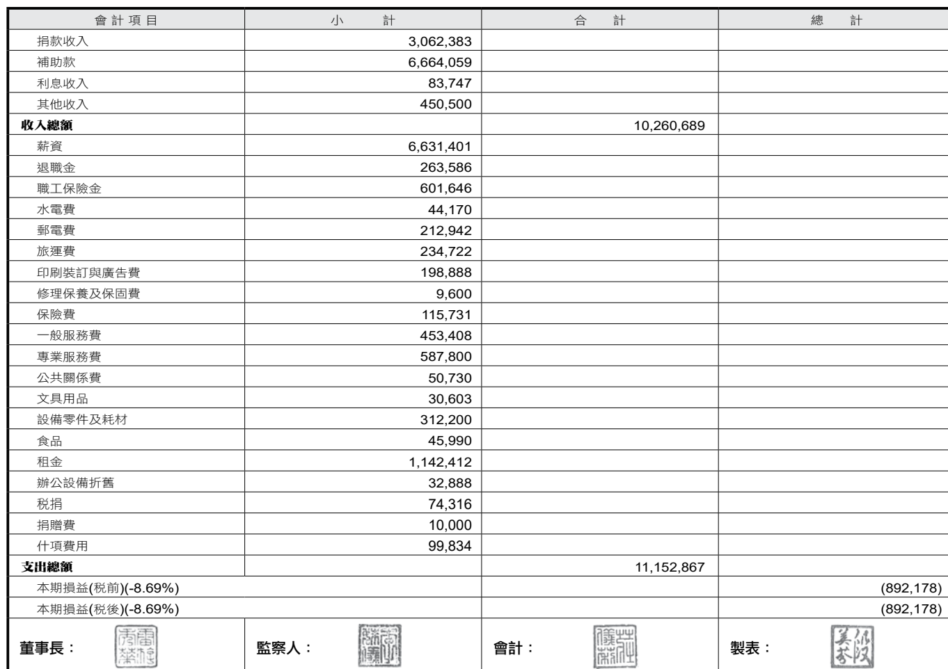
中華民國發展遲緩兒童基金會收支表~109年01月01日至109年12月31日